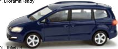
ab August 2011 lieferbar! delivery in August 2011 461542 VW Sharan 2010, DioramaReady 19,50 €