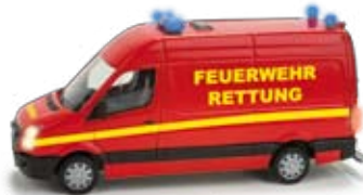
ab September 2011 lieferbar! delivery in September 2011 461580 VW Crafter RTW „Feuerwehr Rettungsdienst“, DioramaReady 29,50 €