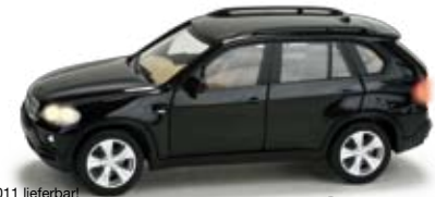
ab September 2011 lieferbar! delivery in September 2011 461566 BMW X5™, DioramaReady 19,50 €