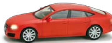
ab Oktober 2011 lieferbar! delivery in October 2011 461559 Audi A7® Sportback, DioramaReady 19,50 €