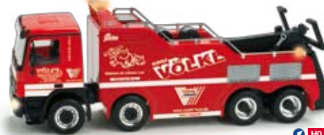
ab Oktober 2011 lieferbar! delivery in October 2011 461597 Mercedes-Benz Actros M '02 Empl Wrecker „Völk Straubing“, DioramaReady 49,50 €