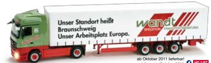
ab Oktober 2011 lieferbar! delivery in October 2011 461610 Mercedes-Benz Actros LH '08 Gardinenplanen-Sattelzug Mercedes-Benz LH '08 curtain canvas semitrailer „Wandt“, DioramaReady 39,50 €