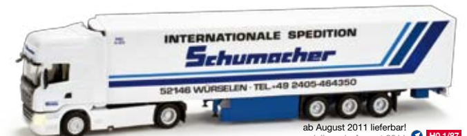
ab August 2011 lieferbar! delivery in August 2011 461627 Scania R '09 TL Kühlkoffer-Sattelzug Scania R '09 TL refrigerated semitrailer „Schumacher“, DioramaReady 39,50 €

Herpa Miniaturmodelle GmbH . Postfach 40 . 90597 Diethenhofen . Germany . Tel. +49(0)9824.951-00 . Fax +49(0)9824.951-200 . www.herpa.de