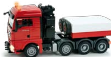
ab September 2011 lieferbar! delivery in September 2011 461603 MAN TGX XXL 680 Schwerlastzugmaschine mit Ballastpritsche / MAN TGX XXL 680 heavy duty with ballast platform, DioramaReady 29,50 €